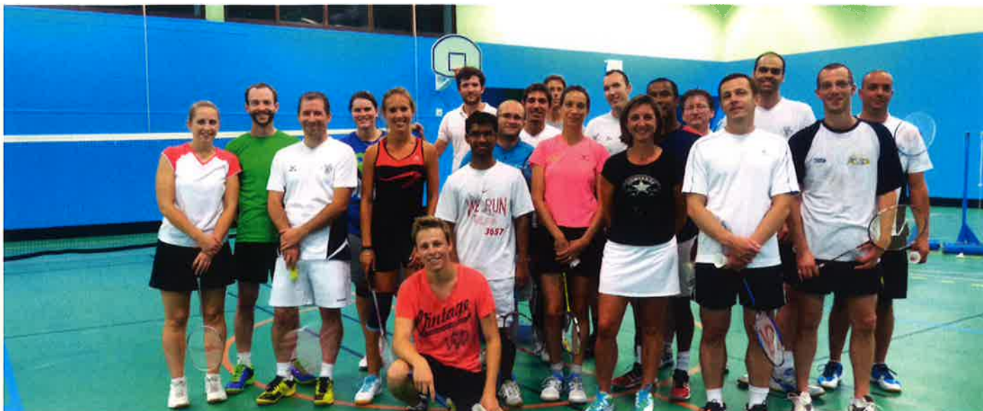
Ci-dessus : L'équipe des compétiteurs du club Versailles Badminton, avec la présidente et quelques membres du bureau